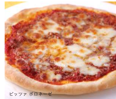
ピッツァ ボロネーゼ