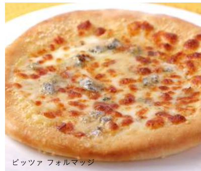
ピッツァ フォルマッジ