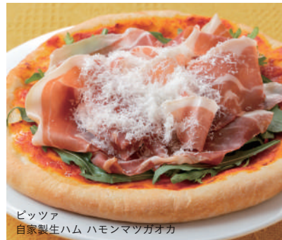
ピッツァ 自家製生ハム ハモンマツガオカ