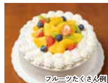
フルーツたくさん例