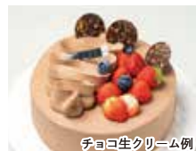
チョコ生クリーム例