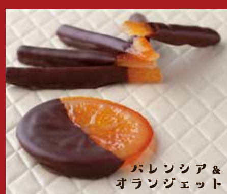
バレンシア & オランジェット