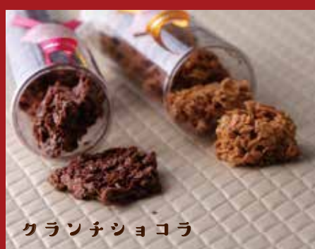
クランチショコラ