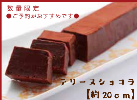
テリーヌショコラ 【約20cm】