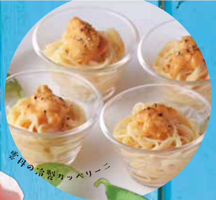
雲丹の冷製カッペリーニ